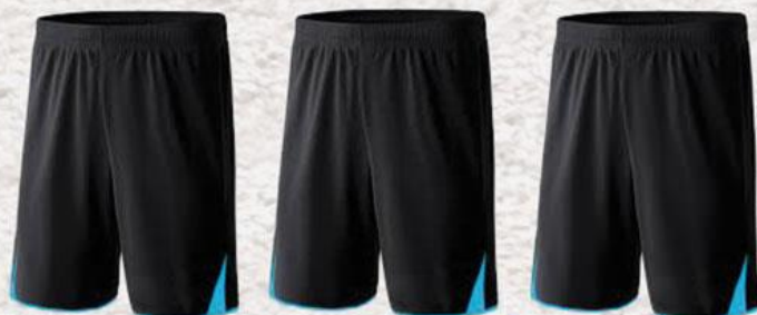
Modèle et couleur identiques