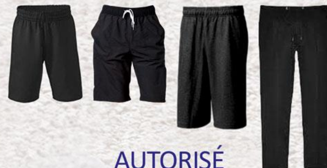
Modèle et couleur identiques